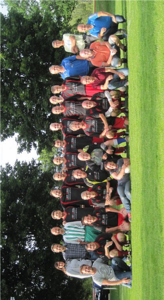
Die AH-Mannschaft des SC March